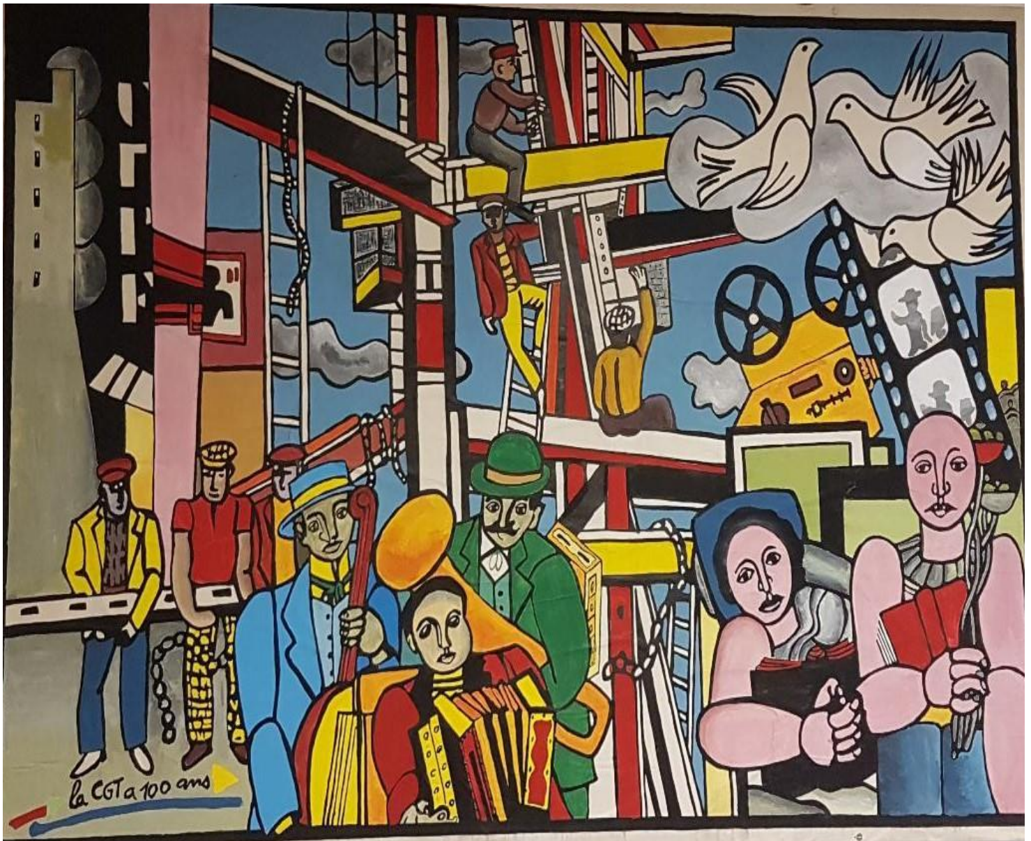
Fernand Léger-Les Constructeurs-

S'INFORMER | SE FORMER | NÉGOCIER | COMPRENDRE | COMMUNIQUER | CONSEILLER | ÉCHANGER